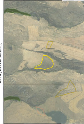
Απόσταση Μερικής Κυρωμένου Δασικού Χάρτη ΦΕΚ(713Δ/24-10-2023).

ΥΠΕΥΘΥΝΗ ΔΗΛΩΣΗ (απ. 8 Ν.1559/1986) Απλόκοι υπεύθυνα, όπως προβλέπεται από την παρ. 5 του άρθρου 20 του ν. 3889/2010 που τροποποιήθηκε από το άρθρο 48 του ν. 4685/2020 ότι: Η έκταση με κορυφές "Α,Β,Γ,Δ,Ε,Ζ,Η,Θ,Ι,Κ,Λ,Α", και εμβαδόν 7125,08τ.μ., που βρίσκεται εντός του αγροτεμαχίου της Τ.Κ. Χαλκίδα του Δήμου Φλώρινας, δεν εμπίπτει στις διατάξεις εν γένει εκτός του διαβιβράζοντα με την Αρ.Πρωτ. 1353/09-2022 απόφαση της Δ.νσης Δασών Φλώρινας, κυρωμένη με το Φ.Ε.Κ. 713Δ/24-10-2022 και βρίσκεται αναρτημένος στην ιστοσελίδα https://es.ktimimta.gov.gr/es/infopla . Η έκταση έχει λάβει χαρακτηρισμό ΔΑ (Δ.Δ.1) με αριθμό έκτασης).