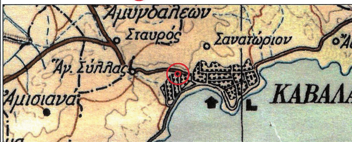
ΧΑΡΤΗΣ ΠΡΟΣΑΝΑΤΟΛΙΣΜΟΥ ΚΛΙΜΑΚΑ 1:100.000 ☉:Θέση επέμβασης

ΕΘΝΙΚΟ ΤΥΠΟΓΡΑΦΕΙΟ Για τεχνικούς λόγους στο σχεδιάγραμμα, από το ηλεκτρονικό αρχείο, έγινε σμίκρυνση κατά ποσοστό 81%