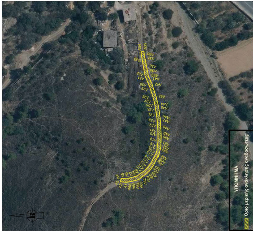
ΚΛΙΜΑΚΑ 1 : 1000

Μερική ανάκληση της υπ' αρ. 2056/18.09.1998 (ΦΕΚ 858/Δ'/29-10-98) απόφασης του Νομάρχη Χίου περί κήρυξης ανασασωτέας, ως προς έκταση συνολικού εμβαδού 298,99 τ.μ. στη θέση «Λιβάδια» Δ.Ε. Χίου, Δήμου Χίου, Π.Ε. Χίου.