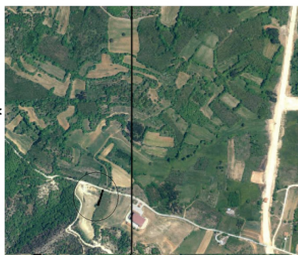
ΑΠΟΣΠΑΣΜΑ Ο/Φ 2015 Κλίμακα 1:20.000