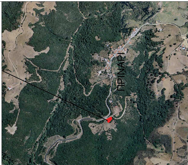
ΑΠΟΣΠΑΣΜΑ ΧΑΡΤΗ ΚΤΗΜΑΤΟΛΟΓΙΟΥ ΚΛΙΜΑΚΑΣ 1:10.000 ΘΕΣΗ ΕΚΤΑΣΗΣ

ΕΛΛΗΝΙΚΗ ΔΗΜΟΚΡΑΤΙΑ ΥΠΟΥΡΓΕΙΟ ΠΕΡΙΒΑΛΛΟΝΤΟΣ & ΕΝΕΡΓΕΙΑΣ ΕΠΙΘΕΩΡΗΣΗ ΕΦΑΡΜΟΓΗΣ ΔΑΣΙΚΗΣ ΠΟΛΙΤΙΚΗΣ ΠΕΛΟΠΟΝΝΗΣΟΥ, ΔΥΤΙΚΗΣ ΕΛΛΑΔΑΣ ΚΑΙ ΙΟΝΙΟΥ ΔΙΕΥΘΥΝΣΗ ΔΑΣΩΝ ΗΛΕΙΑΣ ΔΑΣΑΡΧΕΙΟ ΑΜΑΛΙΑΔΑΣ