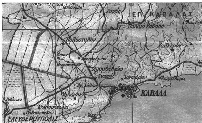
ΧΑΡΤΗΣ ΠΡΟΣΑΝΑΤΟΛΙΣΜΟΥ ΚΛΙΜΑΚΑ 1:200000 Θέση επέμβασης

Το παρόν αποτελεί αναπόσπαστο μέρος της υπ' αριθ. 234932/175-2024 απόφασης του Γενικού Γραμματέα Δασών Υ.Π.ΕΝ.