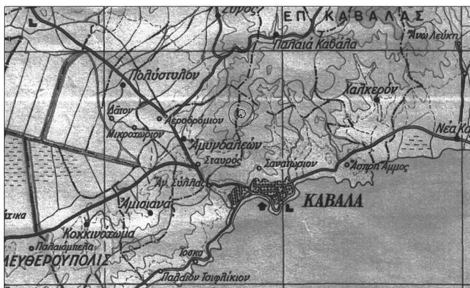
ΧΑΡΤΗΣ ΠΡΟΣΑΝΑΤΟΛΙΣΜΟΥ ΚΛΙΜΑΚΑ 1:200000 Θέση επέμβασης

Το παρόν αποτελεί αναπόσπαστο μέρος της υπ' αριθ. 234295/16.5.2024 απόφασης του Γενικού Γραμματέα Δασών Υ.Π.ΕΝ.