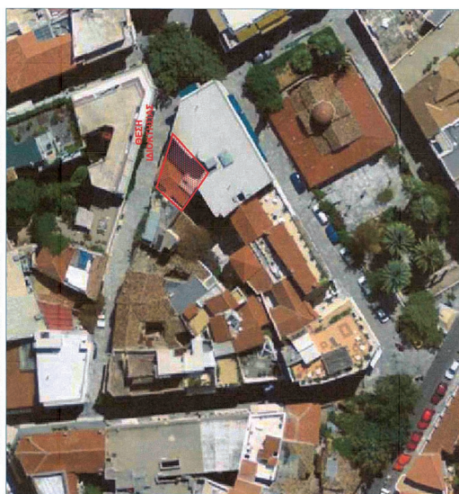
ΑΠΟΣΤΑΣΙΑ ΑΕΡΟΦΩΤΟΓΡΑΦΗ ΚΤΗΜΑΤΟΛΟΓΙΟΥ ΠΕΡΙΟΧΗ - ΟΔΟΣ ΑΡΧΑΙΟΛΗΤΗΣ ΧΑΙΡΕΦΩΝΤΟΣ-ΑΡΧΑΙΟΥ - Δ. ΑΘΗΝΑΙΩΝ Π.Ε. ΚΕΝΤΡΙΚΟΥ ΤΟΜΕΑ ΑΘΗΝΩΝ - Π. ΑΤΤΙΚΗΣ - ΕΤΟΣ ΛΗΨΗΣ ΑΦΩ.Ν. 2007-09 - ΚΙΜΑΚΑ 1:500